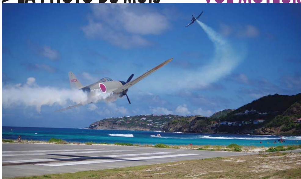
Bucket 2015 Airshow le samedi 21 mars 2015