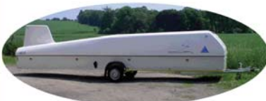
Remorques Avionic pour aéronefs