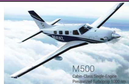
M500 Cabin-Class Single-Engine Pressurized Turbo-prop 1000 nm