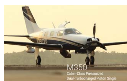
M350 Cabin-Class Pressurized Dual-Turbocharged Piston Single