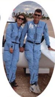
Combinaisons de vol Kiloyankeepapa