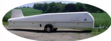
Remorques Avionic pour aéronefs