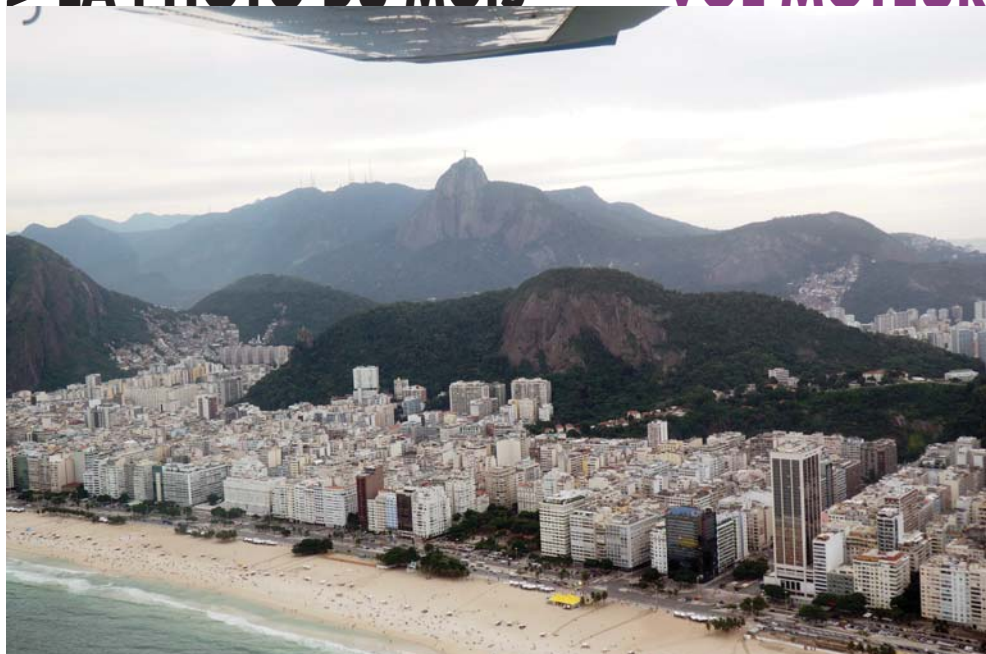
Rio de Janeiro avec un Cessna 182. Survol d'Ipanema, leblon et Copacabana à 500 ft. Raid Latécoère. Mai 2015.