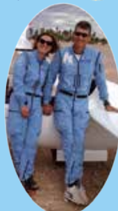
Combinaisons de vol Kiloyankeepapa