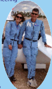
Combinaisons de vol Kiloyankeepapa