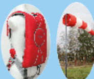
et manches à air Air-Pol