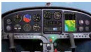
Accès facile : aérodrome Châtellerault LFCA - Autoroute A10 - TGV 1h30 de Paris