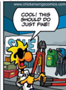
Chuck : Cool ! Ça devrait faire l'affaire !