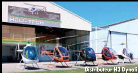
Distributeur H3 Dynali

ENTRETIEN MAINTENANCE MONTAGE DE KIT EQUILIBRAGE ROTOR