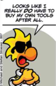
Chuck : Il semble que je dois vraiment acheter mes propres outils après tout.