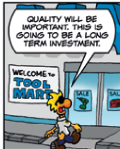
Chuck : La qualité est importante. Ça va être un investissement à long terme.