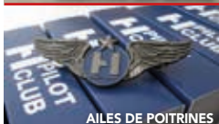
AILES DE POITRINES