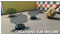
CRÉATIONS SUR MESURE

MATÉRIELS MILITAIRES Produits réservés au seul usage du Ministère de la défense et à ses sous-traitants habilités