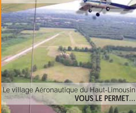
Le village Aéronautique du Haut-Limousin VOUS LE PERMET...